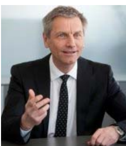
Univ. Prof. Dr. Dr.h.c. Josef Zechner

Im pazifischen Raum ist es zu einer weiteren Verbesserung des Spängler IQAM Sentiment Index Pacific von -0,22 (per Ende Februar) auf -0,06 (per Ende März) gekommen. Der Trend der Vormonate wird damit fortgesetzt. Der positive Trend ist durch die kontinuierliche Verbesserung der Marktstimmung zu begründen. Der Spängler IQAM Sentiment Index Pacific befindet sich im neutralen Bereich.